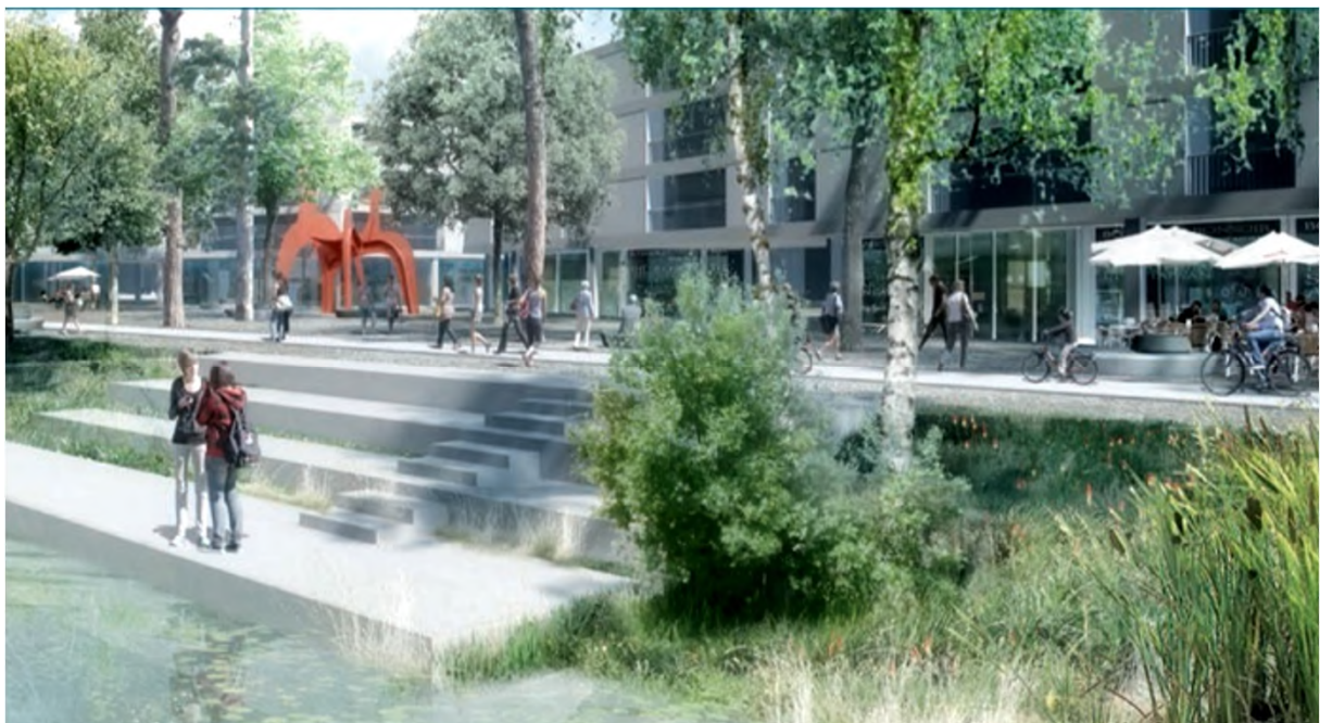
Figure 1 : Illustration tirée du rapport du PDL Gare-Lac – Vision de l'espace public majeur le long du canal oriental et de la rue de l'Ancien-Stand

une demande de crédit d'étude de CHF 960'000.- pour une stratégie d'implication de la population dans la mise en œuvre du Plan directeur localisé (PDL) Gare-Lac.