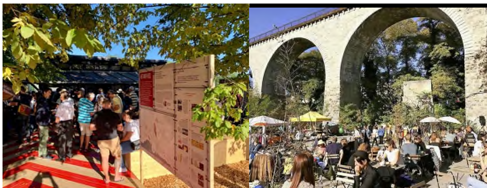
Figure 3 : Maison du projet des Plaines du Loup (Lausanne) et buvette « La Galicienne » (Prilly Malley)