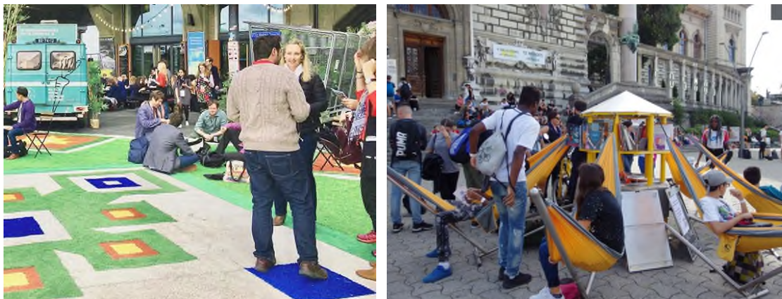
Figure 4 : Erreur ! Référence de lien hypertexte non valide. , Genève / Urbz : Riponne-Tunnel, Lausanne.

La préfiguration consiste en la mise en place d'un aménagement avec un usage réversible d'une durée déterminée, ayant comme but symbolique de se projeter dans les nouveaux quartiers. Il peut s'agir d'une " étape intermédiaire ", anticipant la réalisation de l'aménagement ou des constructions à terme, ou d'un aménagement permettant une appropriation des lieux. Elle permet d'expérimenter les usages et l'espace dans la perspective du changement à venir. En ce sens, elle peut impliquer directement les usager.e.s dans la réalisation (p.ex. associations, riverains, etc...). Les formes de préfiguration sont donc très variées et peuvent inclure à des degrés différents les citoyen-ne-s.