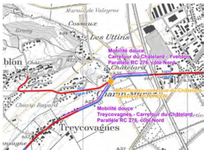
Figure 1 : Plan de situation

Le financement de cette seconde mesure a fait l'objet d'une convention entre les Communes d'Yverdon-les-Bains et de Treycovagnes, ainsi que l'Etat de Vaud, sur la base des surfaces traitées sur chaque territoire.