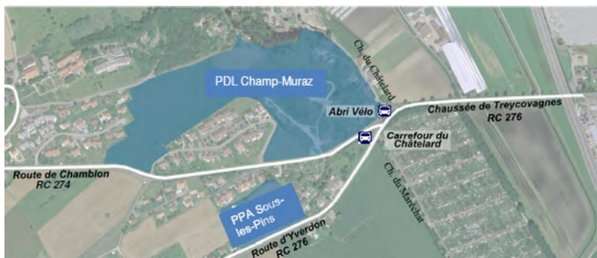
Figure 4 : Projets urbains d'importance dans le secteur concerné

Ce tracé est stratégique, compte tenu de la réalisation future de plans d'affectation de part et d'autre de la Chaussée de Treycovagnes. Des projets d'importance s'inscrivent en effet dans le développement futur des communes de Treycovagnes et de Chamblon. Le PPA « Sous les Pins » ainsi que le PDL « Champs-Muraz » sont des projets en cours d'élaboration. Selon les études menées à cet égard par AggloY, ces communes connaîtront respectivement, d'ici à 2030, une croissance démographique importante, de l'ordre de 600 habitants (population actuelle de Treycovagnes: 451 habitants ; Chamblon: 542 habitants). Le renforcement des infrastructures entre la ville-centre et les villages est donc très important.